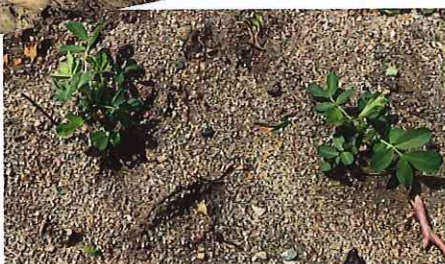
かつ くに げんざい ようす (5月27日 現在の様子)